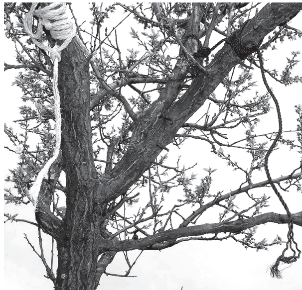
Ryc. 2. Widok pętli – dwie samochodowe linki holownicze Fig. 2. View of the tourniquets – towrope from a car

Zaskakującym znaleziskiem był nietypowo ukryty list samobójczy, złożony i przymocowany taśmą klejącą do skóry pod pachą ojca (ryc. 3.). W liście opisano zdarzenia, do jakich doszło w ostatnim okresie życia obu mężczyzn, i wyjaśniono przyczyny, dla których zdecydowali się odebrać sobie życie w opisany sposób.