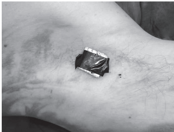
Ryc. 3. Rejon pachy – miejsce ukrycia listu samobójczego Fig. 3. Armpit region – placement of the suicide letter